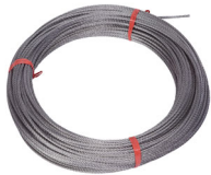
Cable de acero inoxidable, diámetro 2,3 y 4 mm